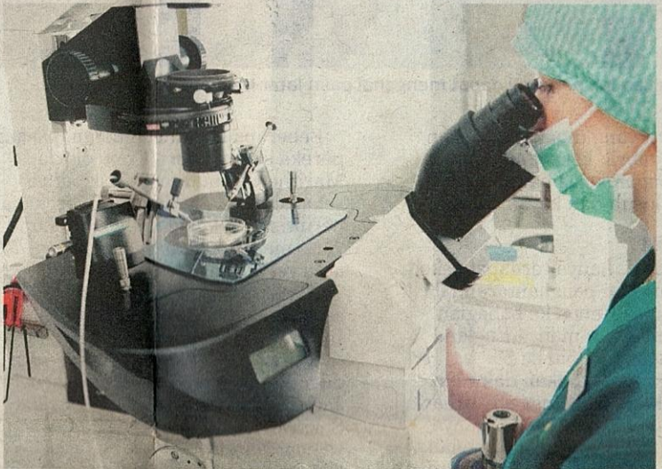
KAEDAH IVF merupakan salah satu penyelesaian masalah infertiliti yang popular.